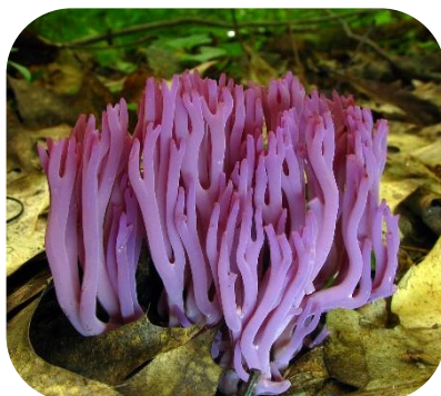
Figure 9 : © Archenzo, Wikimedia Commons