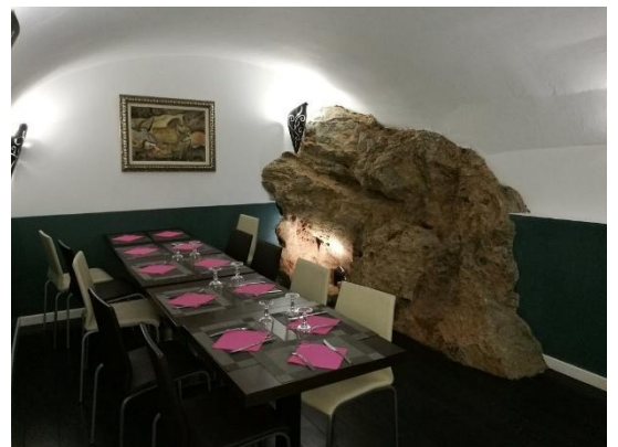
Figure 5.1 : Photographie du restaurant U San Teofalu