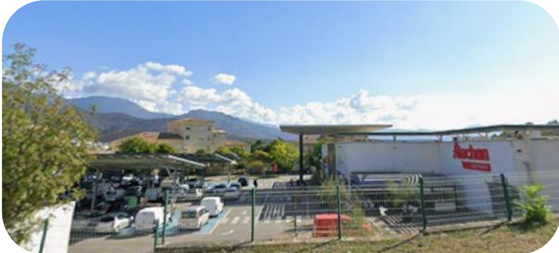
Figure 6 : Photographie du parking Auchan

Point maps : https://maps.app.goo.gl/aKSkqmNB2JqFTyFM6