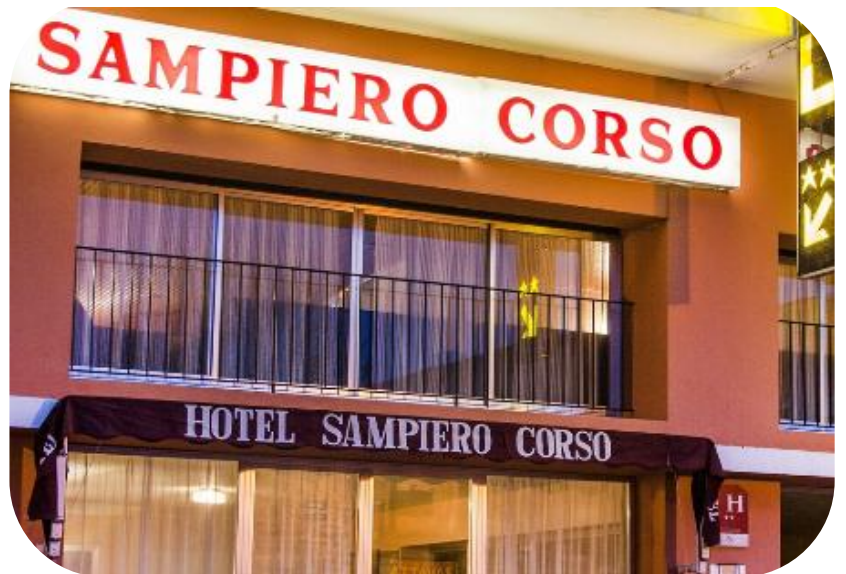
Figure 3 : Photographie de l'hôtel Sampiero Corso

Restaurant Ce sera le San Teofalu qui nous accueillera pour les repas, sauf le petit déjeuner qui se tiendra dans chacun des hôtels.