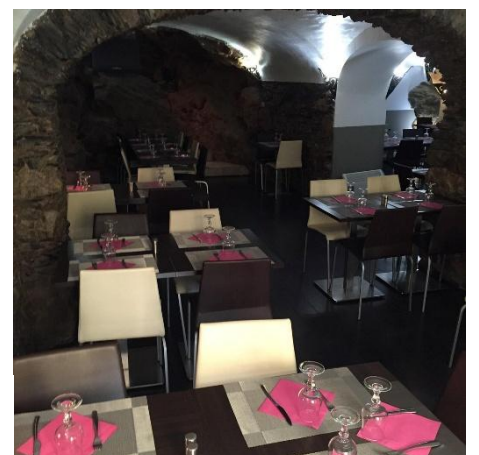
Figure 5.2 : Photographie du restaurant U San Teofalu