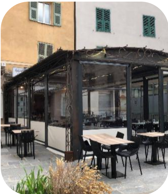
Figure 5 : Photographie du restaurant U San Teofalu

Restaurant Ce sera le San Teofalu qui nous accueillera pour les repas, sauf le petit déjeuner qui se tiendra dans chacun des hôtels.