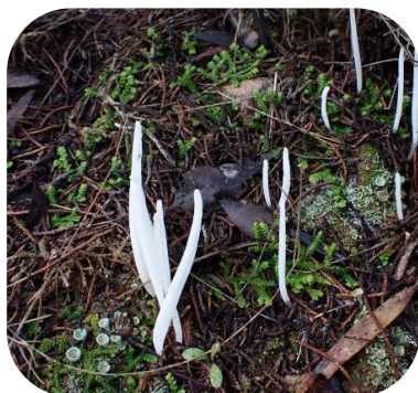
Figure 10 : © Maya HENTIC, CBNC

Mercredi matin, chacun aura le choix d'étudier ses échantillons en salle, ou de suivre un atelier sur les clavarioides proposé par Michèle Raillère-Burat.