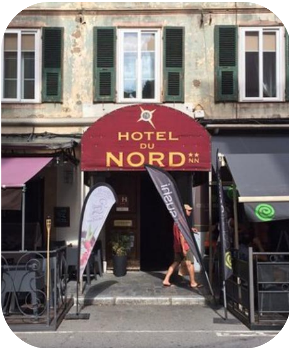
Figure 4 : Photographie de l'hôtel du Nord