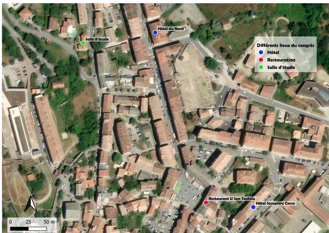
Figure 2 : Plan montrant où sont situés les différents lieux du congrès

Le congrès ayant lieu dans le Centre Corse en automne, il nous a été difficile de trouver une structure réunissant toutes les salles dont nous avons besoin. De ce fait il y aura deux hôtels, une salle de restaurant et une salle d'étude. Mais tous les trajets entre ces sites pourront se faire à pied (cela est même recommandé au vu des places de parkings disponibles dans le centre-ville). Afin de vous aider à vous repérer facilement voici un plan de la ville permettant de localiser les différents sites.