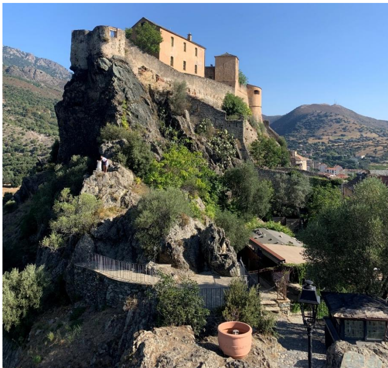
Figure 1 : Photographie de la citadelle de Corte

Le congrès se tiendra du 2 au 6 novembre 2026 à Corte.