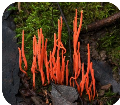
Figure 8 : © Bernard Spragg, Wikimedia Commons