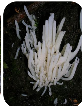
Figure 7 : © Byrdyak, Wikimedia Commons